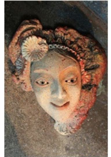
Radha Vachère amoureuse du garçon à la peau bleue