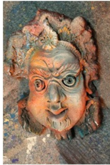
Kamsa Roi de Matura