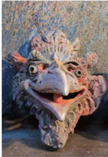
Masque de Garuda le messenger des Dieux