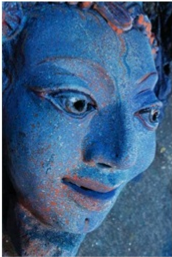
Le garçon à la peau bleue