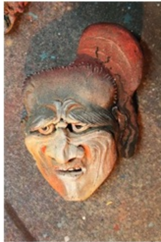
Drithman Serviteur de Kamsa